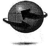
Istituto S. S. di Cairo M.